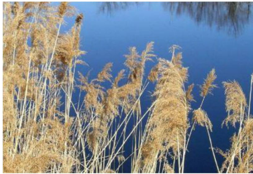
Épis de phragmite