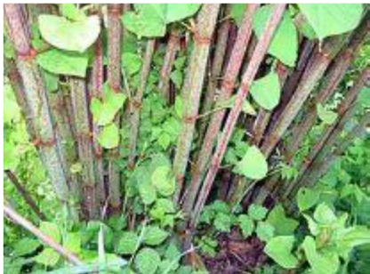
Tiges de renouée

Tiges creuses, comme le bambou et dont les racines peuvent briser l'asphalte ou le béton. Si vous en avez sur votre propriété, il est très important de la contrôler. Elle est quasiment impossible à éradiquer.