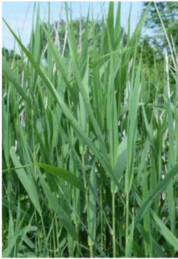
Tiges de phragmite

Si vous en repérez sur votre propriété, il est important de la couper régulièrement afin de l'affaiblir et de mettre les tiges dans les déchets. Si vous en avez au bord de l'eau, tenter de le contrôler car le phragmite se répand à grande vitesse sur les berges. Cette plante est très présente dans nos fossés et autour du lac Nick.