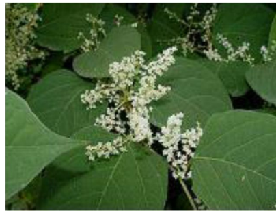
Feuilles et fleurs de renouée